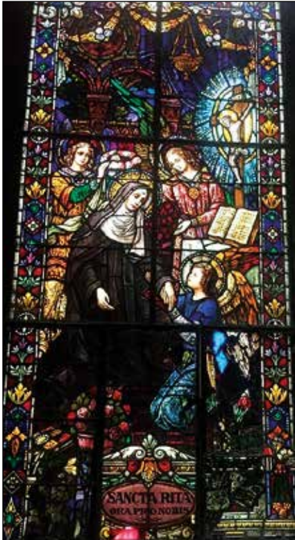
Vidriera de la Iglesia del Cristo del Buen Viaje.

habitamos la parte superior del edificio que es el convento. En el despacho parroquial “tenemos los archivos de más de 300 años