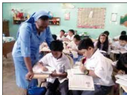
Preparación para los sacramentos

Más que enseñar la religión, como cualquier otra materia, nos esforzamos para