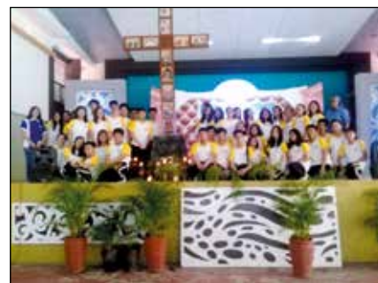
Con niños y jóvenes de catequesis.

Los estudiantes necesitan asesoramiento para conocer y comprender sus emociones, aclarar sus dudas y conflictos.