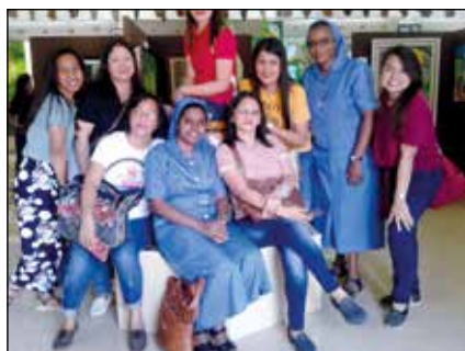
Agustinas, con jóvenes filipinas

También preparamos a nuestros alumnos para los sacramentos de la Primera Comunión, Confirmación y Confesión. Además de la catequesis, ayudamos a estos niños en la preparación para la misa, lecturas, canciones, examen bíblico y otros actos religiosos y lúdicos.