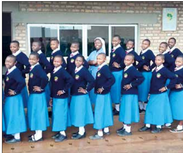
Escuela secundaria de Wino

región sur del país. Desde entonces, y hasta hace un par de años, cada curso han terminado bien preparadas muchas jóvenes ilusionadas con su vocación y profesión de docentes.