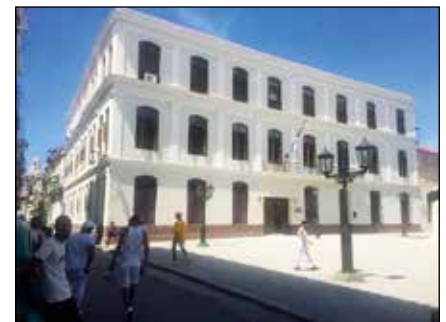
Colegio recién restaurado.

Contamos actualmente con tres parroquias y seis sacerdotes. En dos de nuestras parroquias hay dos comunidades de religiosas misioneras. En estas parroquias,