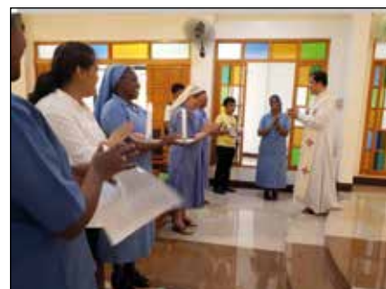
Bendición de la casa de formación.