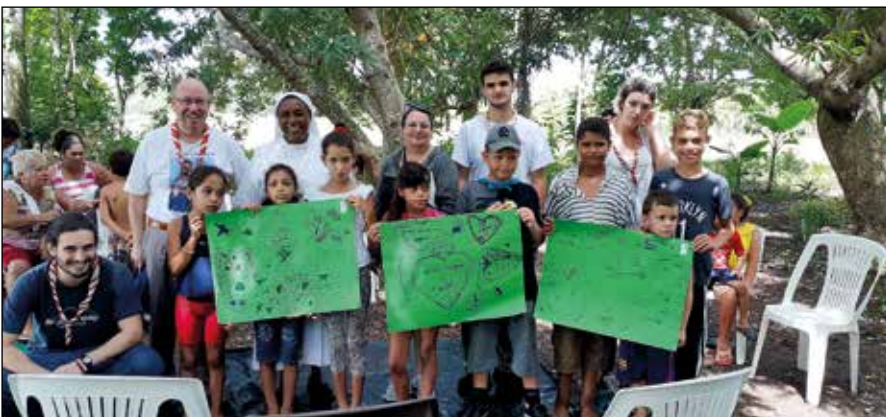
En la Comunidad de Bazarales en Puerto Padre.

En el barrio de Manibón, además de ayudar a las hermanas a distribuir el desayuno, la merienda y el almuerzo, nos dividimos en tres grupos por edades. Había niños desde los 4 a los 13 años. Las actividades de la mañana comenza-