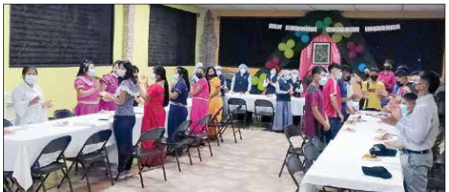
Comida de celebración en el 44 aniversario.