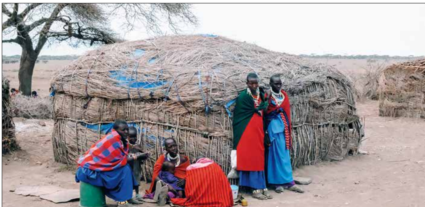
Mujeres Maasai delante de sus casas.

Su sistema familiar – que es generalmente poligámico-, está vinculado a su sistema de producción: la existencia de muchas cabezas de ganado y de muchas esposas que dan a luz hijos para que cuiden del ganado en las diferentes “bomas” o poblados. Hay que recordar que por cada esposa el marido tiene que asegurar una cierta cantidad de ganado para proporcionar leche a la familia, aunque los animales permanezcan como propiedad del marido.