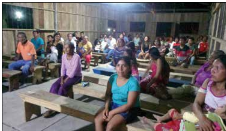
Asistiendo a una celebración.

Hablar de la selva es hablar de naturaleza y a la vez de teología de la ecología. La selva es sabia no solo por su tiempo sino por como se ha adaptado a las adversidades. La vida religiosa puede aprender mucho de la creación de Dios. La creación cuando se ve amenazada no se rinde. Y la selva en su sabiduría, ante siglos de explotación y contaminación, sigue adelante. Dios ha puesto en su ser la capacidad de regenerarse y no perder su esencia por medio de los espíritus.