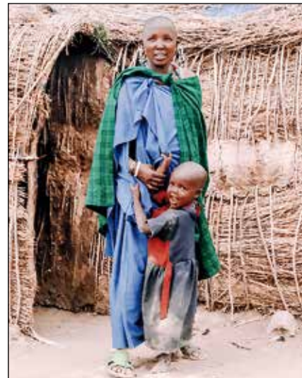
Mujer Maasai con su hijo.

Su sistema familiar – que es generalmente poligámico-, está vinculado a su sistema de producción: la existencia de muchas cabezas de ganado y de muchas esposas que dan a luz hijos para que cuiden del ganado en las diferentes “bomas” o poblados. Hay que recordar que por cada esposa el marido tiene que asegurar una cierta cantidad de ganado para proporcionar leche a la familia, aunque los animales permanezcan como propiedad del marido.