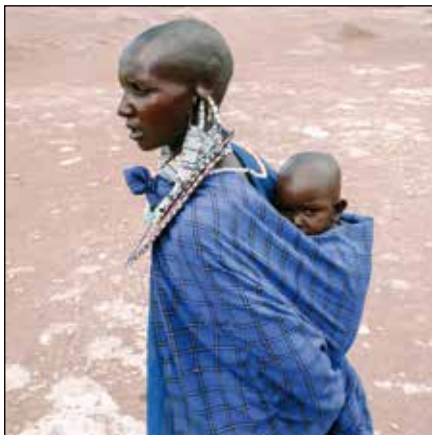
Mujer Maasai con un hijo a cuestas.

Los muchachos más inteligentes son los preferidos para cuidar del ganado. Si se ve que a un muchacho le gustan las ovejas, se le orienta en este sentido. Si prefiere las cabras o las vacas se le dedica a cuidar estos animales. Si se quiere evadir estas prácticas, que para ellos son buenas y funcionan, sería necesario cambiar primero su sistema de producción. De lo contrario, los principios de la Iglesia Católica pueden chocar contra una roca dura. De ahí que todo trabajo de evangelización entre los Maasai ha de considerar estos factores a la hora de realizar la primera evangelización.