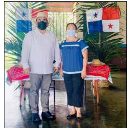
Educadores del centro RESA.

y a la vez rendir un cariñoso y merecido homenaje a los numerosos agustinos, educadores y personal del Centro Misional de Tolé que han mantenido durante todos estos años la actividad incesante y entusiasta de esta realidad misionera y educativa de profunda raigambre en las tierras empobrecidas y olvidadas de Tolé. RESA inició su andadura el 22 de abril de 1978, y lo hizo con un grupo de 28 estudiantes, todos varones. 2 años después se hará un centro mixto e irá aumentando, muy deprisa, el número de residentes hasta un total de 120 a lo largo de muchos cursos, si bien este número ha ido oscilando en el tiempo. El primer director de RESA fue el P. Julio de la Calle, el primer agustino que llegó a la Misión de Tolé.