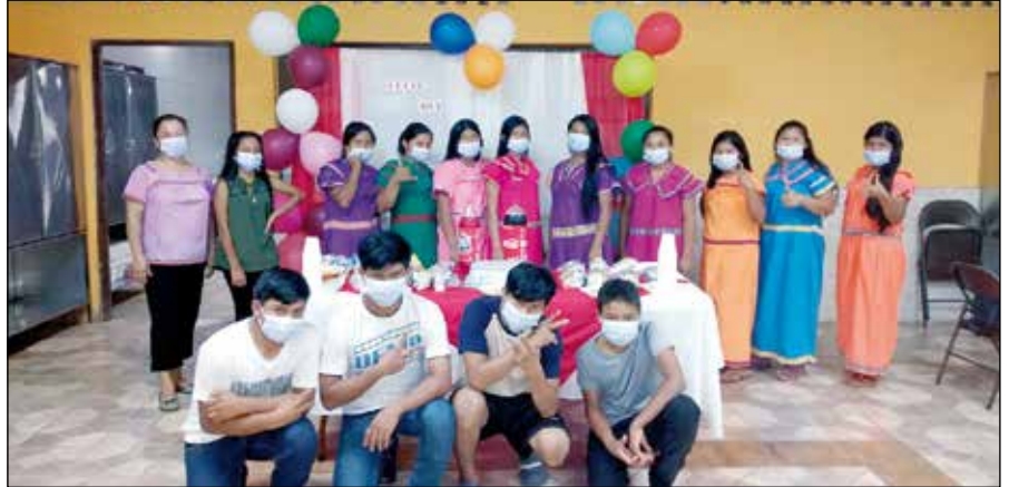
Celebrando el 44 aniversario de RESA.

Con el paso de los años se vio la necesidad de hacer otra Residencia de estudiantes en una de las zonas más alejadas y de más difícil acceso de Tolé. Es en plena Comarca Indígena, en el lugar llamado Llano Ñopo, donde los PP. Agustinos tienen, algo así, como un subcentro misionero, desde el que se atiende pastoral y socialmente a una gran cantidad de familias en su totali-