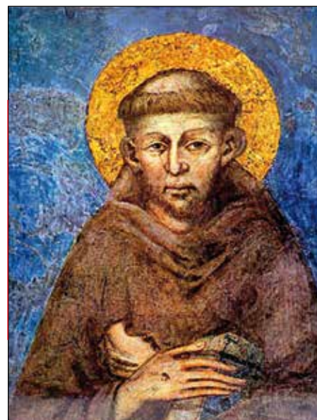
San Francisco de Asís.

¡Señor haz de mí un instrumento de tu paz! Que allí donde haya odio, ponga yo amor. Donde haya ofensa, ponga yo perdón. Donde haya discordia, ponga yo unión. Donde haya error, ponga yo verdad. Donde haya duda ponga yo fe. Donde haya desesperación, ponga yo esperanza. Donde haya tinieblas, ponga yo luz. Donde haya tristeza, ponga yo alegría. ¡Oh Maestro!, que no busque yo tanto ser consolado, como consolar; ser comprendido, como comprender; ser amado, como amar. Porque dando es como se recibe; olvidando, como se encuentra: perdonando, como se es perdonado; muriendo, como se resucita a la vida eterna