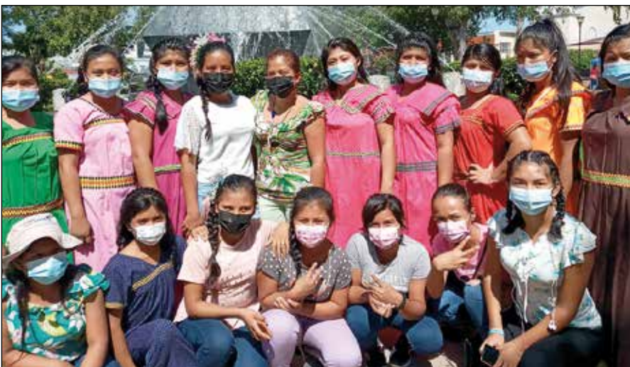
Jóvenes del centro RESA.

Han sido a lo largo de estos años centenares de jóvenes los que han pasado por RESA y que hoy, muchos de ellos, ocupan puestos de notable importancia profesional y social, y que llevan en sus mochilas