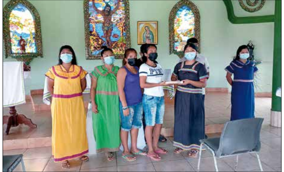
Jóvenes del centro RESA en la capilla.

La ocasión de haberse celebrado en el mes de Abril de 2022 los 44 años de su fundación me da pie para dar a conocer esta realidad misionera que quizá muchos de nuestra Familia Agustiniiana no conozcan,