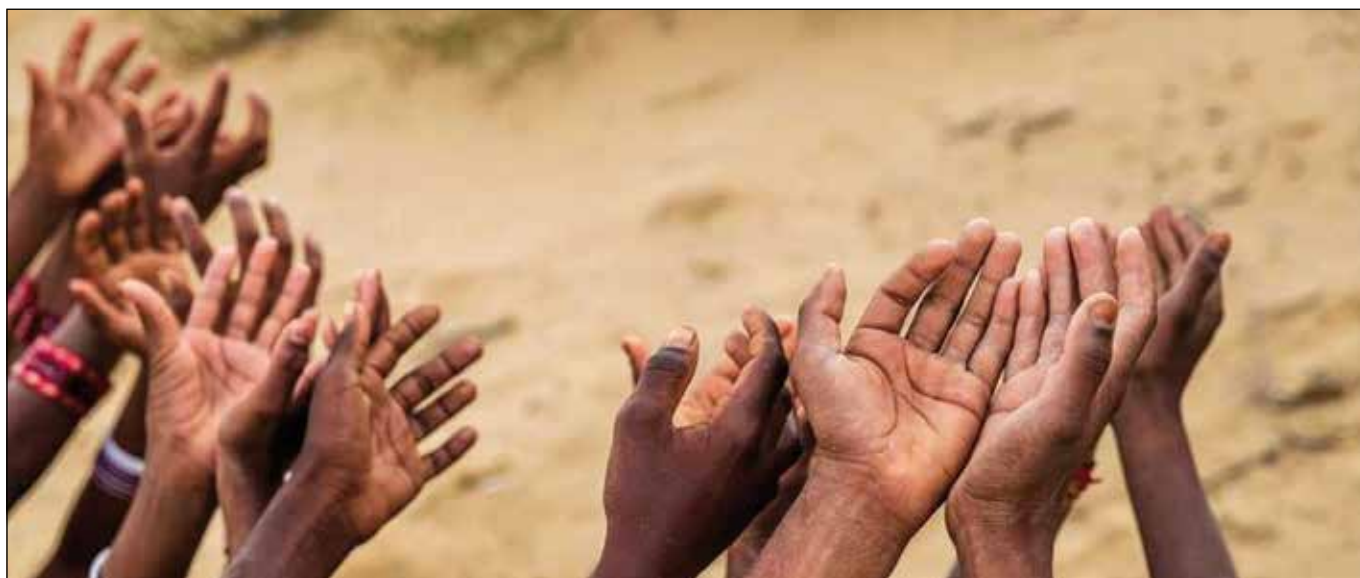
El hambre en el mundo.