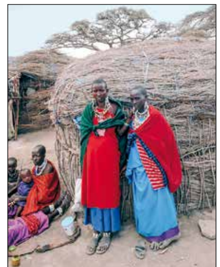
Mujeres Maasai delante de su vivienda.