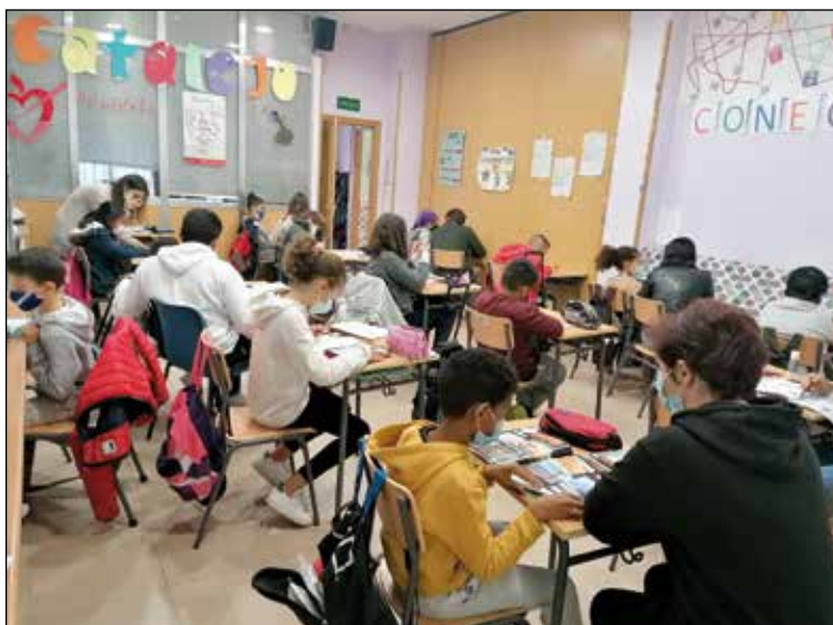
Estudiantes del centro Catalejo.

drid), al que acuden personas sin aloja- miento estable o en situación de calle, y donde se atendieron a 135 personas en el año 2021.