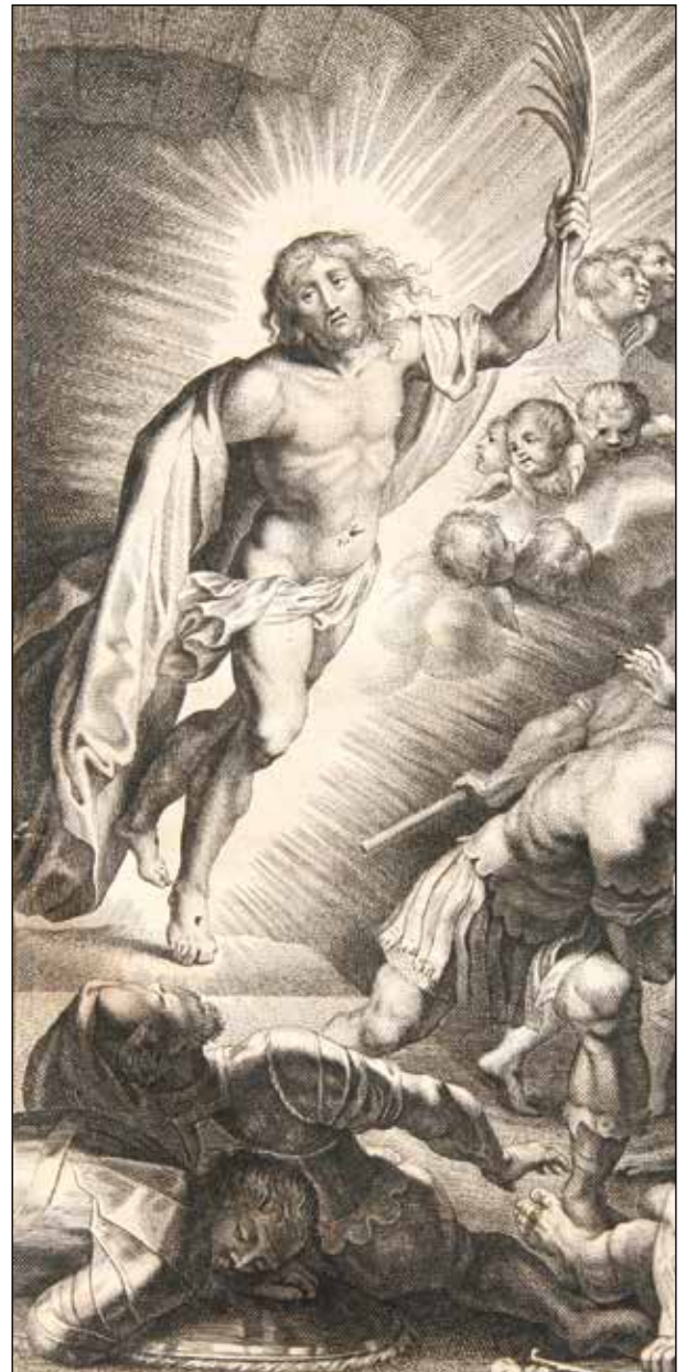
Cristo resucitado. Grabado en Amberes, 1676. (Detalle)