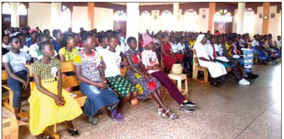
Clausura del programa anti FGM