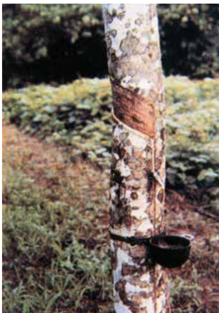
Extracción de caucho en la selva peruana. Foto de 1990

El primer “boom” del caucho se desarrolla entre 1879 y 1912. En esta época se produce un despegue importante en ciudades amazónicas como Manaos (Brasil) e Iquitos (Perú). En ambas se construyen edificios para la ópera. El gran tenor Enrico Caruso llegó hasta Iquitos para deleitar a las élites caucheras. De esta misma época todavía tenemos algunos edificios: la casa de Fierro, el palacio de Vela (ex-hotel Palace), la casa de la Prefectura, la casa Pinasco... Todo al servicio de una élite enriquecida por el caucho.