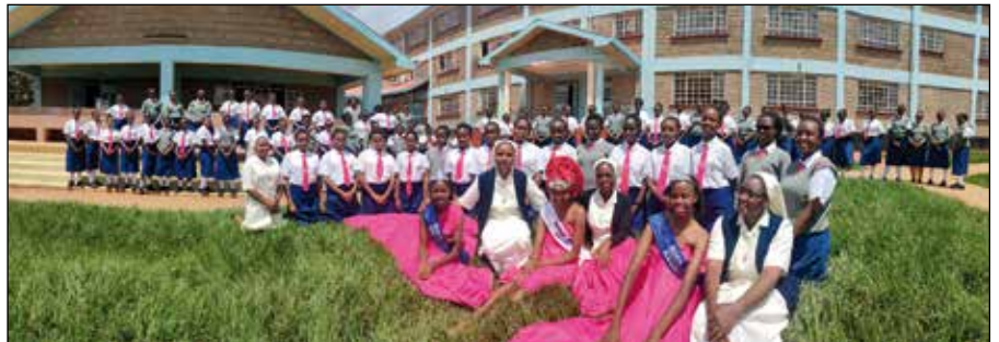
Haciendo crecer otros talentos: modelos y desfiles de moda.