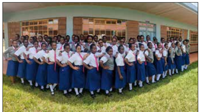
Grupos de alumnas