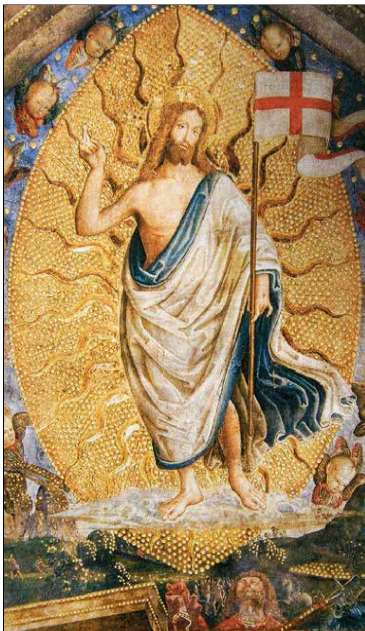
Resurrección de Cristo. Obra de Pinturicchio, (1492-1494) Apartamentos Borgia, Vaticano. (Detalle)