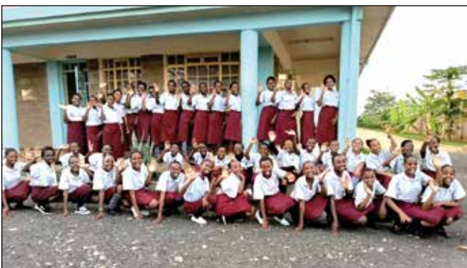
Grupos de alumnas

Nuestra misión tiende gran impacto y relevancia para las niñas de esta zona y para todas aquellas con las que trabajamos en nuestro colegio.