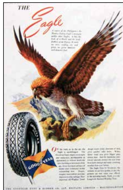
Cartel publicitario de neumáticos “Good Year”. Revista Punch, 12 de julio 1950.

ha sido muy condescendiente con las compañías petroleras, que dejan un territorio devastado de contaminación, enfermedades y daños causados.