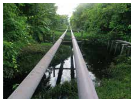
Oleoducto en la selva peruana.

Ambos “boom” forman parte de actividades extractivas, pero en dos periodos históricos diferentes. El caucho pertenece al capitalismo industrial, sirviendo a la producción automovilística, entre otros. El petróleo, como una fuente de energía, sigue explotando irracionalmente el medio ambiente, pero pertenece a una fase posterior del capitalismo: el financiero. Desde comienzos de