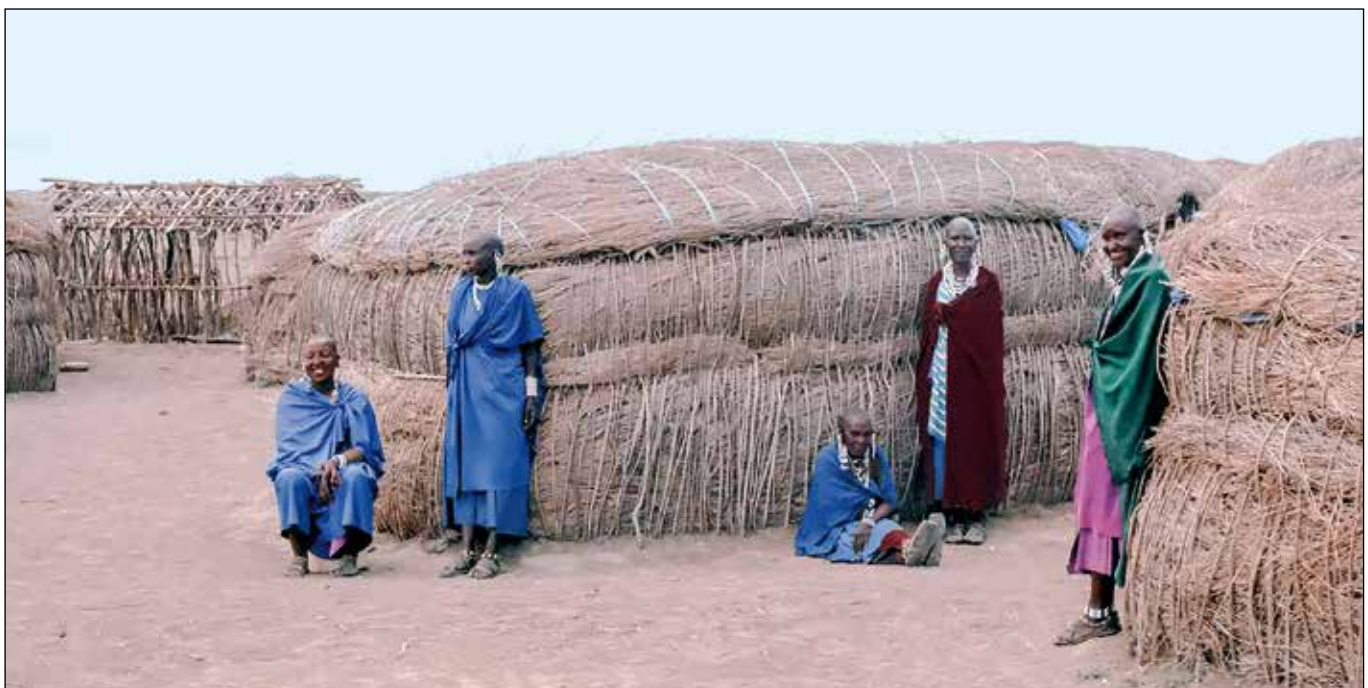
Mujeres Maasai en uno de sus poblados.