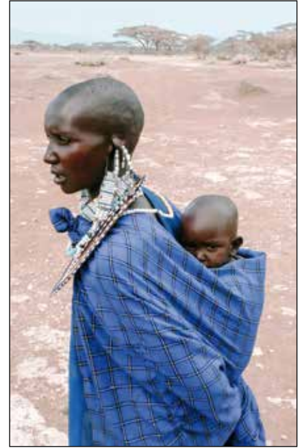
Mujer Maasai con un hijo a cuestras.

En mis encuentros con diferentes jóvenes Maasai me he dado cuenta que – incluso aquellos que han nacido en estos tiempos de un mundo globalizado-, mantienen las prácticas tradicionales. Así, por ejemplo, no son partidarios de enviar sus hijos a la escuela y, de modo particular, a las niñas. Como consecuencia, vemos jovencitas que son dadas en matrimonio a una edad muy temprana. Es curioso que cuando se les pregunta si son felices en esa situación, responden afirmativamente. Parece que