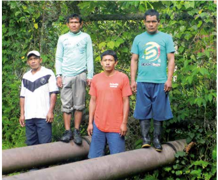
Urarinas junto al oleoducto.

3) Acuden actores internacionales a observar lo que está sucediendo: en el caso del caucho, Inglaterra envió al cónsul