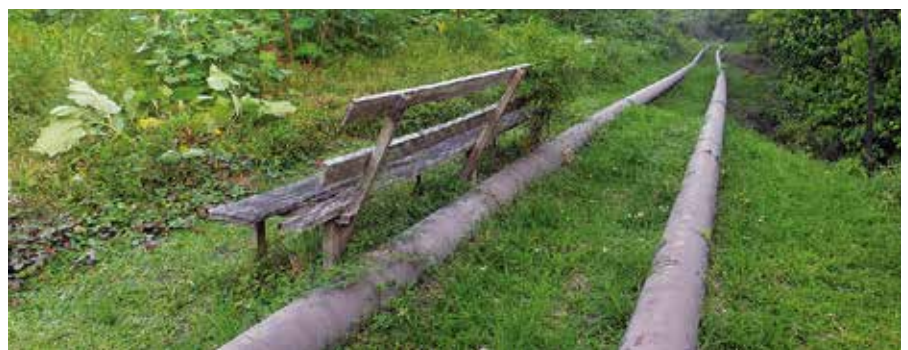
Oleoducto en la región de los Urarinas, del Perú.